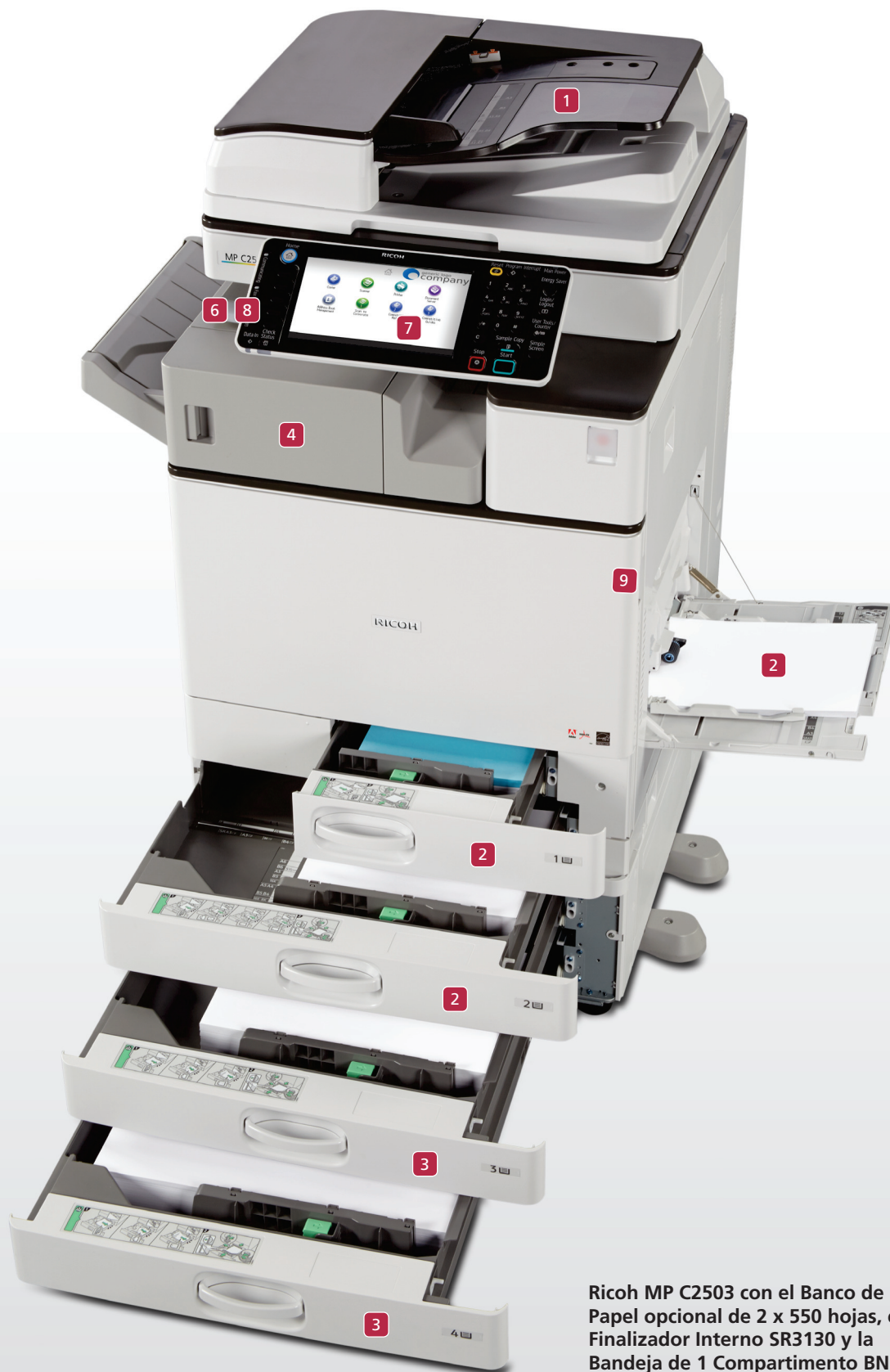
Ricoh MP C2503 con el Banco de Papel opcional de 2 x 550 hojas, el Finalizador Interno SR3130 y la Bandeja de 1 Compartimento BN3110